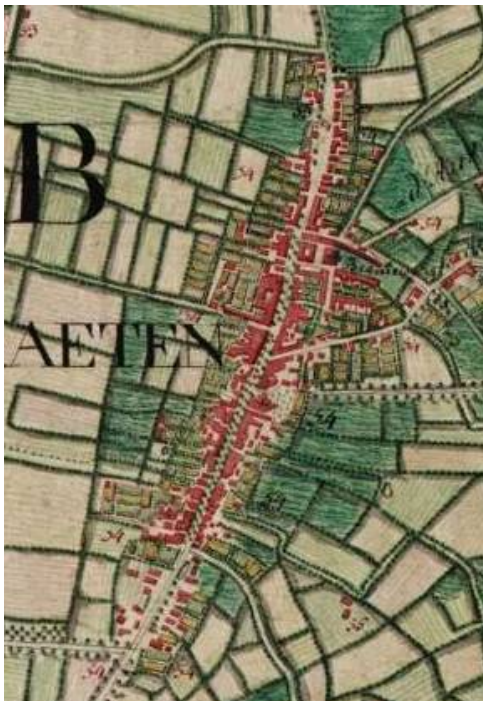
Detail van de kaart van Ferraris

► In een oogopslag zie je al meteen een groot verschil met de situatie van vandaag. Wat is volgens jou het grootste verschil.