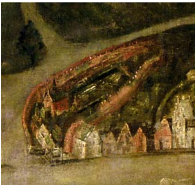
Detail van het schilderij van 1564