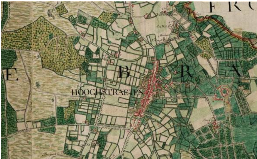
Detail van de kaart van Ferraris

► In een oogopslag zie je al meteen een groot verschil met de situatie van vandaag. Wat is volgens jou het grootste verschil.