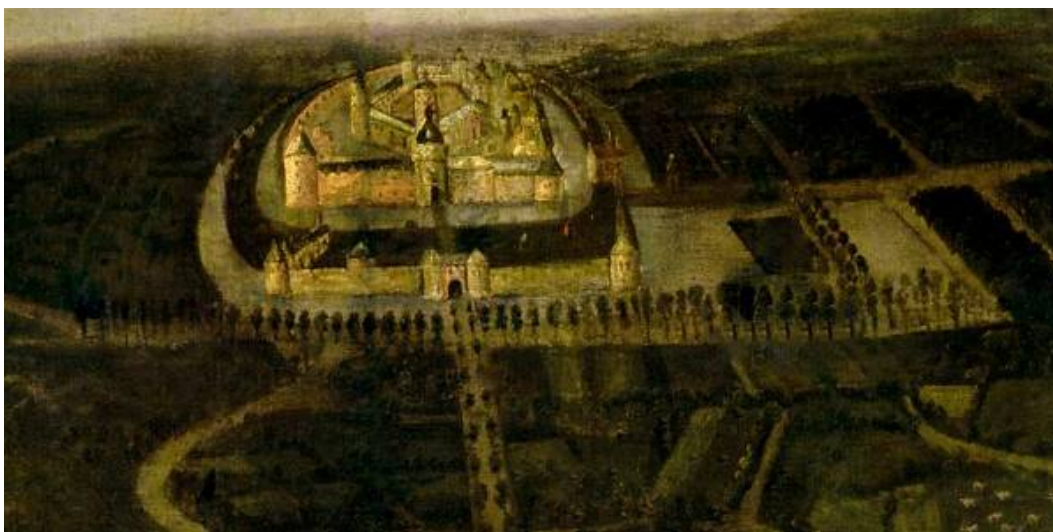
Detail van het schilderij van 1564

► Welke gebouwen en straat herkennen we hier? En wat is de functie van het gebouw vandaag?