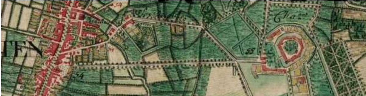
Detail van de kaart van Ferraris

► Welk gebouw rechts herken je hier? Welke straat is duidelijk herkenbaar en verbindt de Vrijheid met dit gebouw?