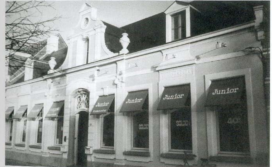
Voorgevel van 'De Kroon'. In de 17de eeuw vinden we achter deze barokke gevel een brouwerij.

De brouwerij van de pastoor van Minderhout heeft slechts 17 jaren gedraaid. Pastoor Van Dijck wordt opgevolgd door pastoor Van Varick en die ziet het nut van een eigen brouwerij niet in. In 1681 besluit hij immers om de brouwinstallatie te verkopen aan een zekere Guiliam Van Pelt, een ketelmaker uit Hoogstraten 42) . De pastoor verkoopt de brouwerij voor slechts 70 gulden omdat de cuyp niet meer dinstich en was en in het brouwen geen profijt en sach 43) . Deze Van Varick maakt van de brouwerij een kamer met een bakhuis.